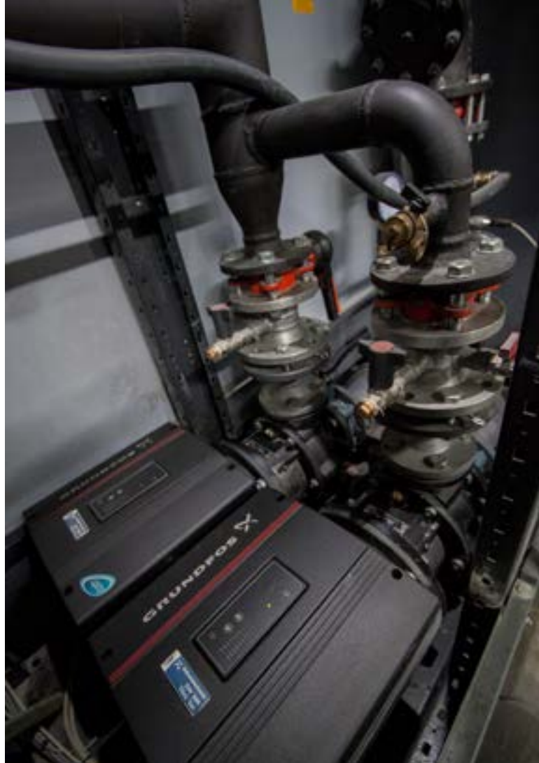
Bild 2 • Grundlage des PumpenEnergieSpar-Concepts bildet die moderne Technologie von Grundfos.